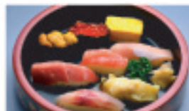
特上生鮓 2,690円 1人前▶ 7貫+玉子