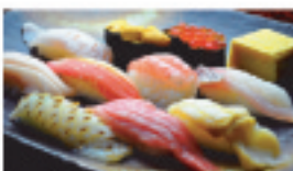
極み鮓 3,500円 例上1.5人前▶ 10貫+玉子