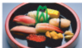
上生鮓 1,990円 1人前▶ 7貫+玉子