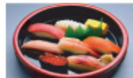
中生鮓 1,650円 1人前▶ 7貫+玉子